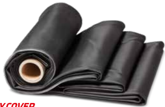
HERTALAN EASY COVER

HERTALAN® EASY COVER wird ohne offene Flamme verarbeitet, ist wurzelfest, FLL-geprüft sowie gegen UV und Ozon beständig. Das System eignet sich für jedes Flachdach – ob lose verlegt mit Auflast, mechanisch befestigt oder verklebt verlegt .