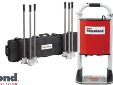
OMG RhinoBond INDUCTION FASTENING SYSTEM

Ein weiterer Vorteil: Durch die Feldbefestigung im Induktionsverfahren wird die Windlast gleichmäßig auf die EPDM-Plane verteilt . So wird die Punktlast je Befestigungsfeld verringert und die Zahl der benötigten Befestigungselemente um bis zu 30% reduziert.