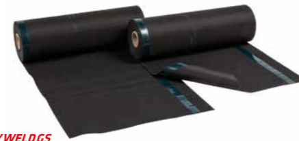
HERTALAN EASY WELD GS

Mit einer Bahnenbreite von 1,4 m und einer Länge von 20 m können zudem mit nur einer Nahtverbindung circa 56 m² Dachfläche abgedichtet werden .